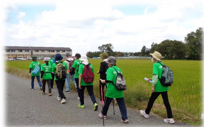
ウォーキング参加者の声

市民ウォーキング 10月16日 「城の山古墳と柴橋歴史探訪コース」 朝方までの雨もやみ、ウォーキングに さわしい天候になりました。コースはほと とHOT・中条をスタート・ゴールとする約5.4km ですが今回は城の山古墳までの往路 をウォーキングして帰路はバスにのりました。