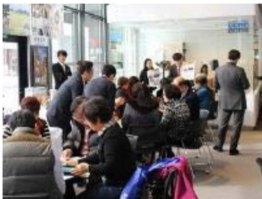
台湾旅行業者との商談会