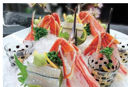
料理の一例(サヨリとズワイガニの湯引き)

山海の幸をはじめ、地元食材を中心に、個室でゆっくりと堪能できるお店です。昼は「予約ランチ「釜めし膳」」。昼、夜は「新潟和食コース」がおすすめです。