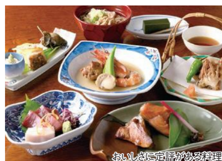
おいしさに定評がある料理

気軽に泊まると重宝されている旅館。旬の食材を使った料理も評判で、宴会や仕出し(1週間前までに予約)も行っており、予算に合わせてきめ細かく対応してくれます。名物「抹茶羊羹」(要予約)も人気があります。