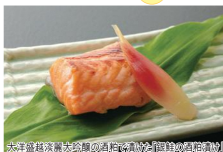
大洋盛越淡麗大吟醸の酒粕で漬けた「銀鮭の酒粕漬」