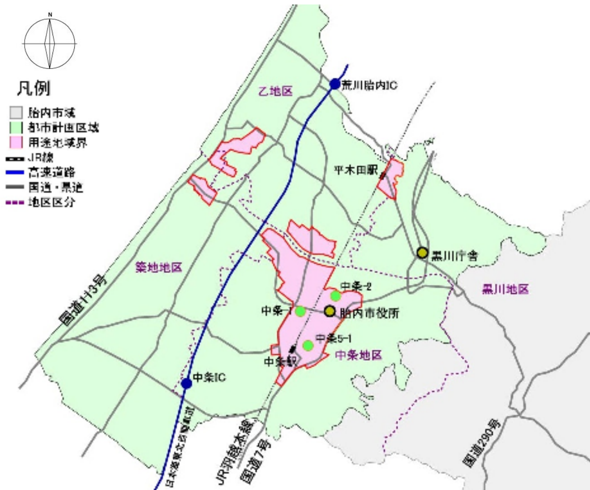
図 1-8-2 地価公示価格