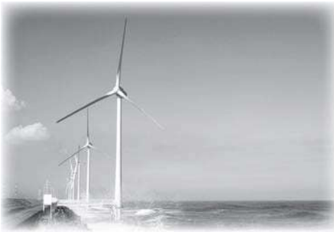
↑会社名：株式会社ウィンド・パワー・いばらき サイト名：ウィンド・パワー・かみす第1洋上風力発電所

世界で最も美しいウィンドファームといわれるコペンハーゲン沖の洋上風力発電