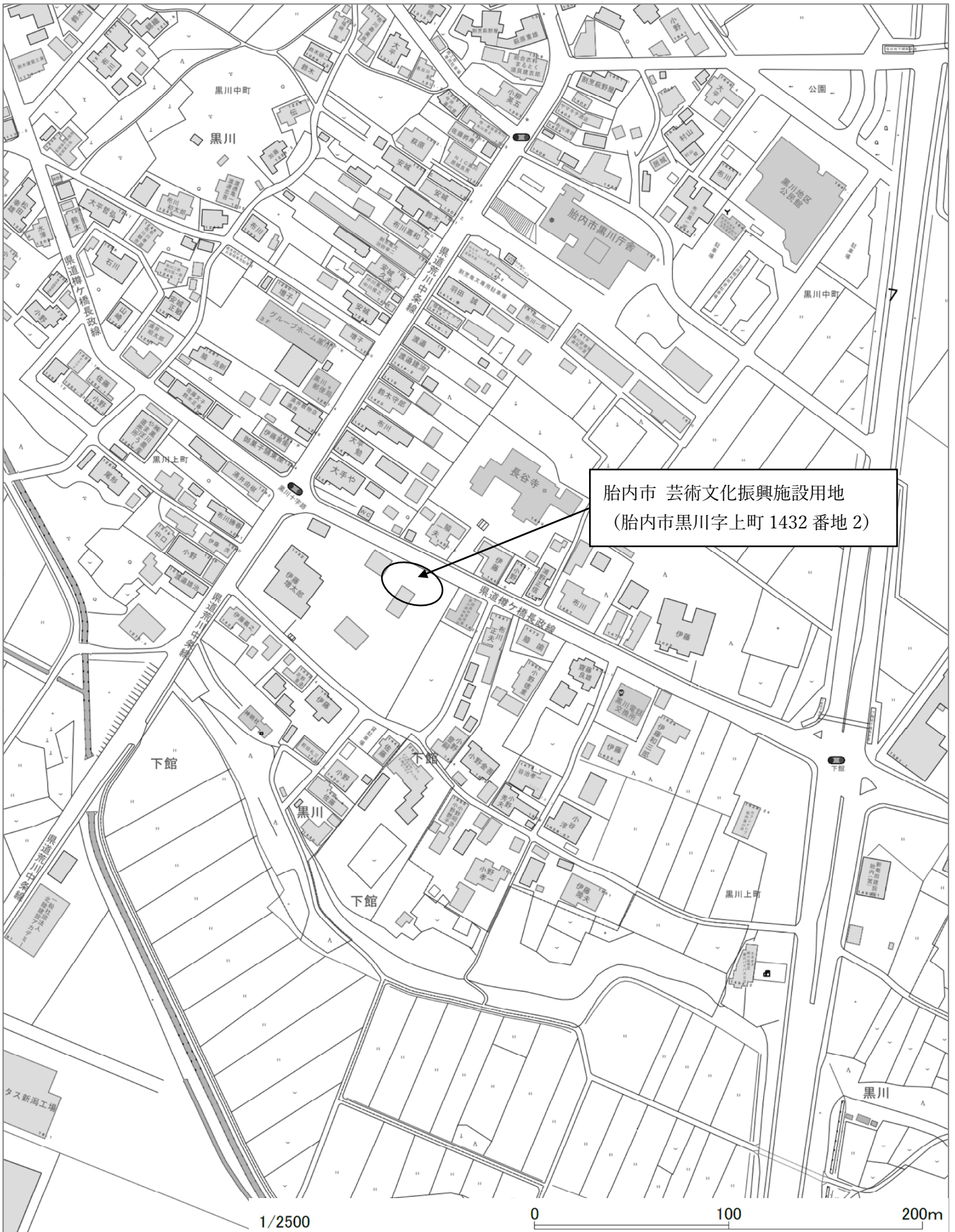
令和 8 年度 黒川地内 立木伐採業務委託 位置図