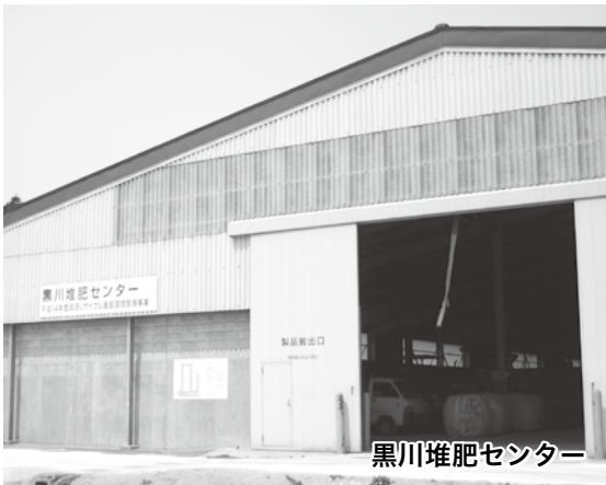
黒川堆肥センター