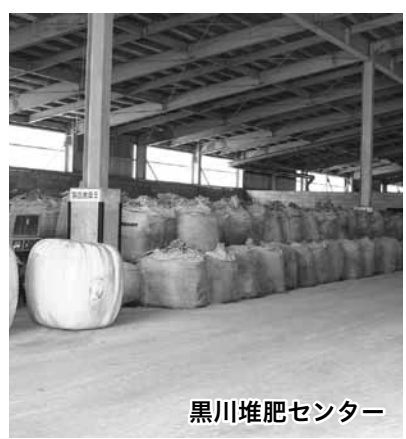
黒川堆肥センター

農林水産省が定めた牧草等の暫定基準値を超える放射性セシウムに汚染されている宮城県産飼料用稲わらを利用して肉用牛農家があることが確認された。県では、県外産稲わらを購入した41農場の検査を行った。市では、8農場が検査対象で、7月19日から3日間検査を行った結果、2農場から放射性セシウムが検出され、この2農場に対し、肉用牛の出荷、堆肥の移動を自粛するよう指導が行われた。そのうち1農場が黒川堆肥センターの利用者で、市では、7月19日から原料搬入自粛を要請するとともに、同センターから堆肥の出荷を停止した。同センターで製造した堆肥の検査結果は330ベクレルで、国の基準値400ベクレル以下だが、農産物に与える影響を考慮し、1,200トンを隔離保管し、販売を行わないこととした。