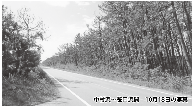
中村浜～笹口浜間 10月18日の写真

農林水産課長 基本的には地上散布、無人ヘリの散布、全部立ち枯れの場所は、抵抗性の強い松を植林して行きたい。