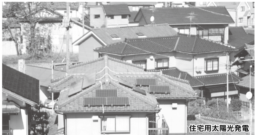
住宅用太陽光発電

市長 市民からの需要も多く、来年度以降もこの制度を実施したい。融資制度等については、設置した方々の意見を聞いて、方向づけをしたい。