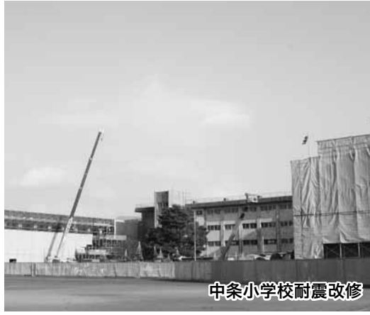
中条小学校耐震改修