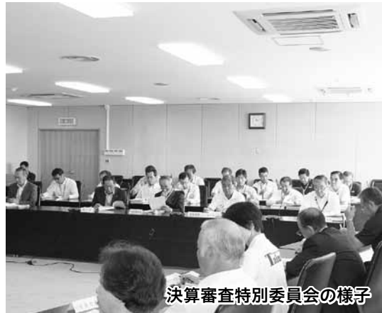
決算審査特別委員会の様子