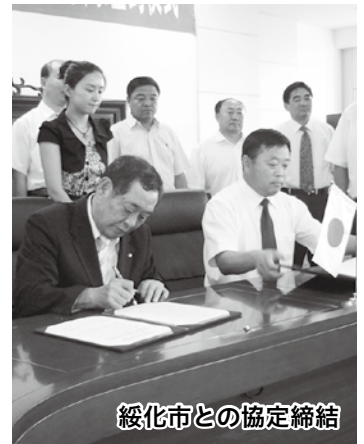
綏化市との協定締結