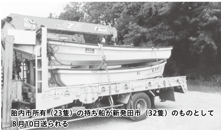
胎内市所有(23隻)の持ち船が新発田市(32隻)のものとして8月10日送られる