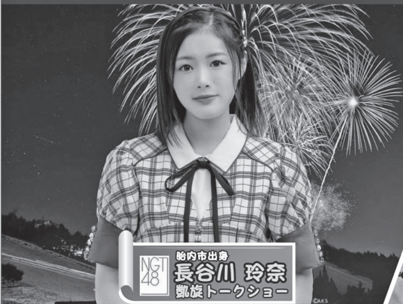
胎内市出身 NGT48 長谷川 玲奈 凱旋トークショー