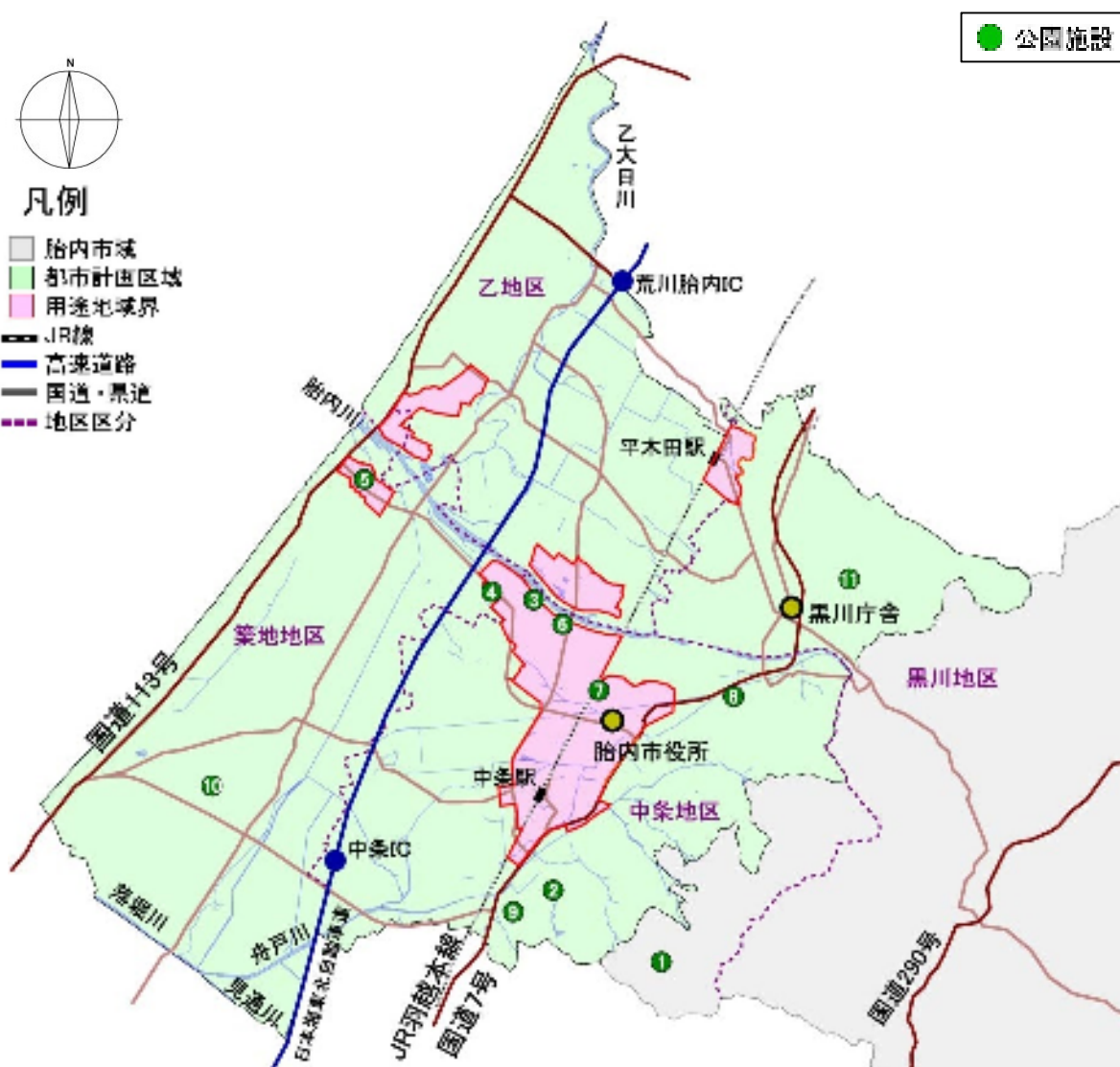
図 1-3-2 道路・河川・公園