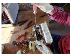
【受託・仕切り組立て】