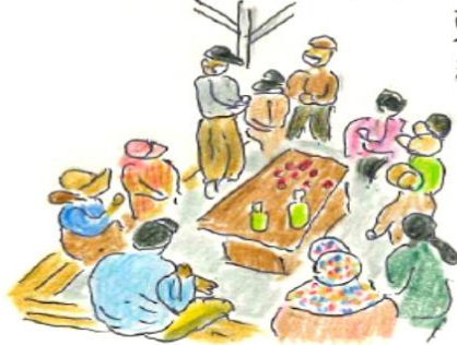
水仙 彼岸花の看板設置