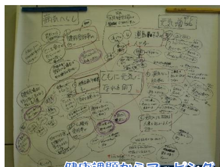
健康課題からマッピング