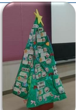
完成したウィッシュツリー