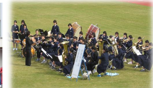
（中条中学校吹奏楽部）